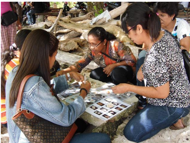
Workshop aan het strand

Met de start van dit project is in het voorjaar van 2010 een stevige basis gelegd voor milieueducatie, met de nadruk op afval. Een groepje deskundige Walcherse vrijwilligers heeft lesmateriaal samengesteld en dit via een uitgebreid programma geïntroduceerd bij alle 195 basisscholen. Dit gebeurde via een symposium voor alle scholen en met trainingen voor de zgn. groene leerkrachten, de „green guru“s. Dit alles op verzoek van gemeente Ambon zelf die Milieueducatie verplicht op het schoolrooster wil hebben. Het project is pas volledig geslaagd als alle 195 scholen binnen enkele jaren „Green School“ zijn geworden. In 2011 ging het project zijn tweede fase in. De onderwerpen uit 2010 Omgevingseducatie en Afval werden geëvalueerd en de nieuwe onderwerpen Groene Omgeving en Energie werden geïntroduceerd.